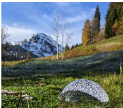
Landschaftlich so schön wird es wieder 2025

Anmeldung bis Ende Juli im Pfarramt telefonisch oder per E-Mail an (0911 770405 oder pfarramt.stmichael.fue@elkb.de). Anfang September erhalten sie alle weitere Informationen mit dem genauen Ablauf. Wir bitten für die Verpflegung etwa 20 €, für Familien 50 € einzuplanen. Wer noch mehr wis-